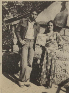
Misini, para se të bëhej ajo,

bukura që i pëlqenin, për të cilat më thoshte ndonjëherë se do të martohej me ndonjëherë. Vallë do të ishte mahi ajo që na kishte shkruar kohë më parë!