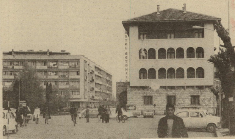
PEJA: KËTU KISHIN MBETUR SHPRESAT