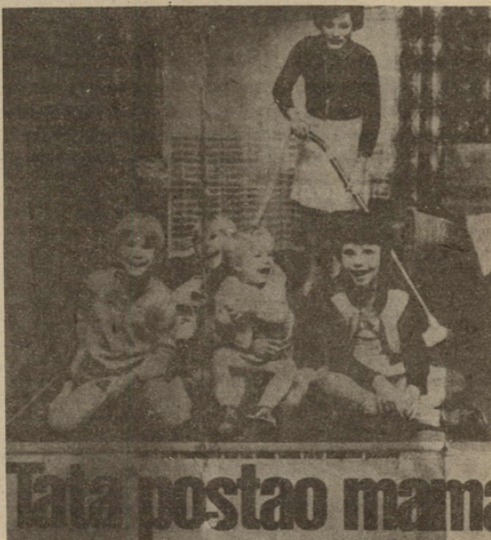
Faksimil i reportazhit nga «Arena»

ndjeja veten keq. Në një anë isha maskkull, e në tjetrën — më pëlqenin maskkujt. Kishte edhe të tillë, meshkuj, që më ofronin dashuri. Por ata ishin homoseksualë. Ashtu s'doja. Do të ketë ilaç, vallë, kjo punë? — e pyeta veten, por rrugëdalje s'gjeja. Kështu kaloi net pa gjumë.