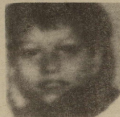
Një kujtim (i grisur) i fëmijërisë

andra» - kështu e kishte shkruar letrën, të parën pasi e kishte ndërruar gjininë, drejtuar prindërve. Letrën do ta shoqëronte edhe me një fotografi, nga e cila do të shihej e bija e tyre, ish-Misini, të cilin e kishin llogaritur djalë. Disa herë, pastaj, e kishte lexuar e rilexuar dhe më në fund e kishte adresuar për në Pejë.