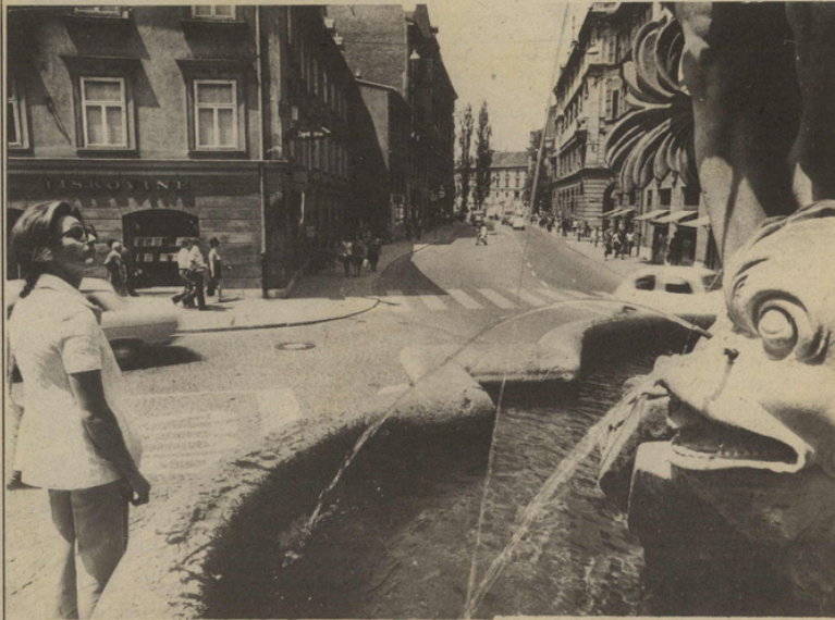
Një pamje e Lublanës

Por, rasti s'mbeti i vetmuar. Me këtë fenomen filluan të merren specialistë të kirurgjisë e të gjinekologjisë, psikiatër... Tash ka lindur edhe një emër i